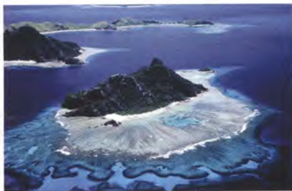
加拉帕戈斯群島遠離煩囂，是世界上極少數不被世俗侵擾的人間天堂。

Lorenz 認為 IWC 正間接地幫助他們在傳媒上宣傳，令更多人可共同關注這人間天堂的生態；同時讓他們有更多時間專注在保育這個群島的工作。Lorenz 認為「時間」反而成為了他們保護這群島的壓力，要在有限的時間內保留著這島中的一切，實在有困難，但他慶幸有 IWC 的全力支持，故他希望與 IWC 合作的腕錶除了得到部份收益作支持外，更可以喚醒眾人對這個世界中碩果僅存的人間天堂的關注。■