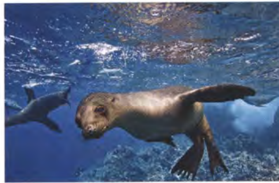
加拉帕戈斯群島棲息了大量獨特的生物，如海獅、巨龜、海洋鬣蜥或著名的達爾文雀等，CDF 與 IWC 都努力研究當地生態，希望可以保留著這些珍貴物種。

IWC 在 2014 年推出了一系列全新 Aquatimer 腕錶，就讓 MR 挑選 2 枚在這給大家先睹為快。